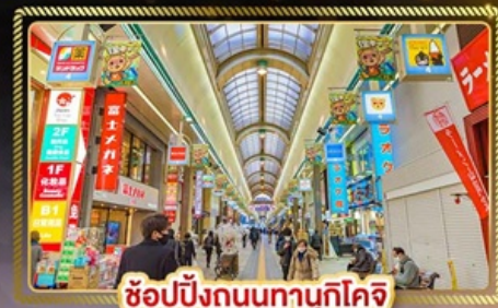
ช้อปปิ้งถนนทานุกิโคจิ