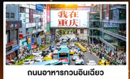
ถนนอาหารถวอนอินเดีย