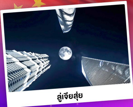
ดูเจียสูย