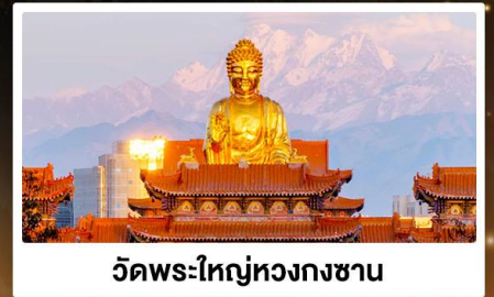
วัดพระใหญ่หวงกงซาน