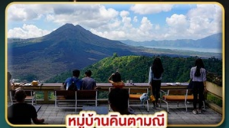
หมู่บ้านคินตามณี