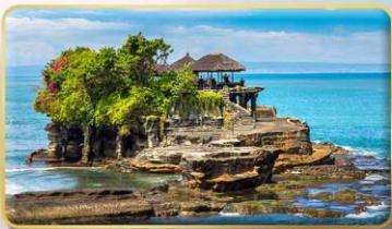
วิหารทานาห์ลอด