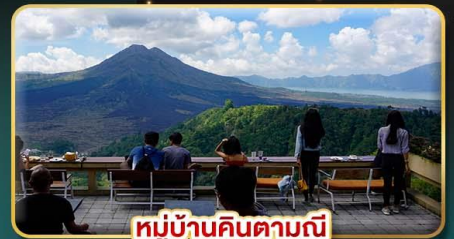
หมู่บ้านคินตามณี