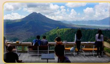
หมู่บ้านคินตามนิ