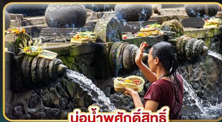
บ่อน้ำพุศักดิ์สิทธิ์