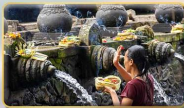
วัดน้ำพุศักดิ์สิทธิ์