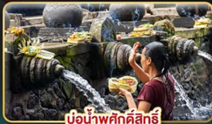
บ่อน้ำพุศักดิ์สิทธิ์