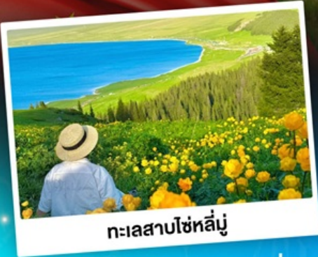
ทะเลสาบโซฮ์ลีมู่