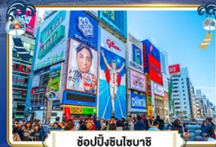
ช้อปปิ้งชินโซบาช