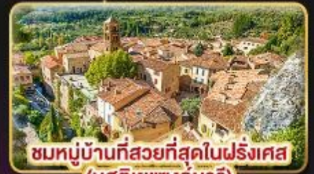
ชมหมู่บ้านที่สวยงามที่สุดในฝรั่งเศส (มูสตีเยแซงต์มาร์)