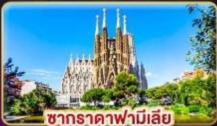
ซากradaฟามีเลีย