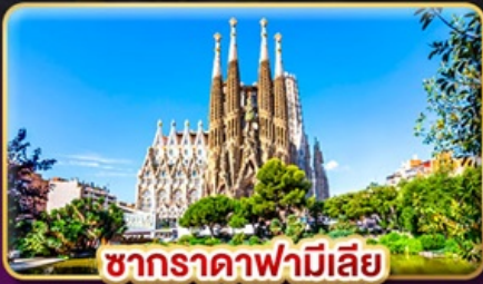
ซากradaฟามีเลีย