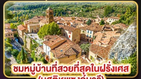
ชมหมู่บ้านที่สวยงามที่สุดในฝรั่งเศส (มูสติเยแซงท์มารี)