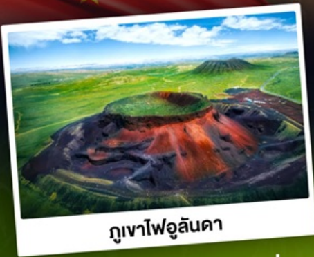
ภูเขาไฟอูลันดา

ท่องดินแดนแห่งทะเลทรายและทุ่งหญ้า ชมพระอาทิตย์ขึ้นทุ่งหญ้าออร์ดอส