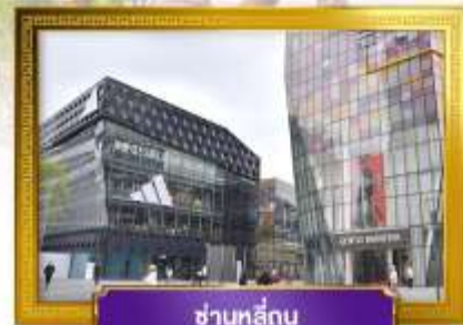
ชานหลู่กู่