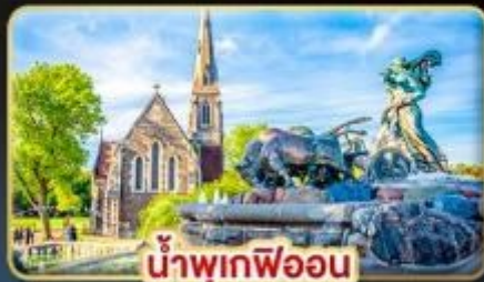
น้ำพุเทพีออน