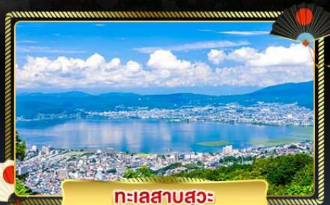
ทะเลสาบสุวะ