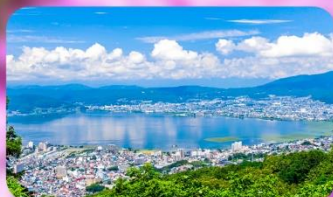
ทะเลสาบสุวะ