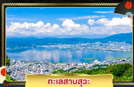
ทะเลสาบสุวะ