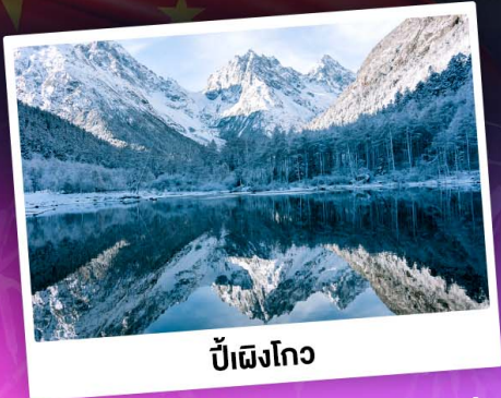
ป่าเผิงโกว

ท่องเขาแอลป์เมืองจีน "ภูเขาสี่ดรุณี" ชมความสวยงามของอุทยานป่าเผิงโกว