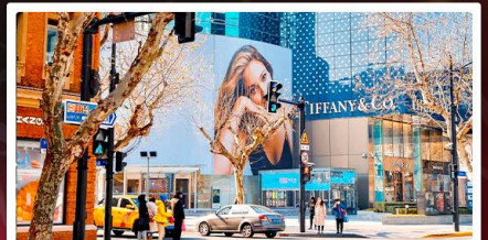
ถนนหวยไห่มีดเคิลส์โรด