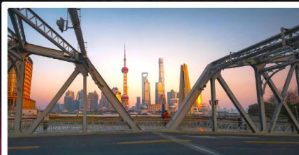
สะพานไวไปตู้