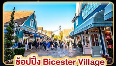
ช้อปปิ้ง Bicester Village