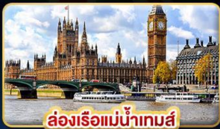
ล่องเรือแม่น้ำเทมส์