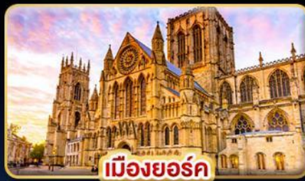
เมืองยอร์ก