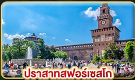
ปราสาทฟอร์เชสโก

📅 เดินทาง : 28 พ.ค. - 06 มิ.ย. | 05-14 ส.ค. 15-24 ต.ค. 69