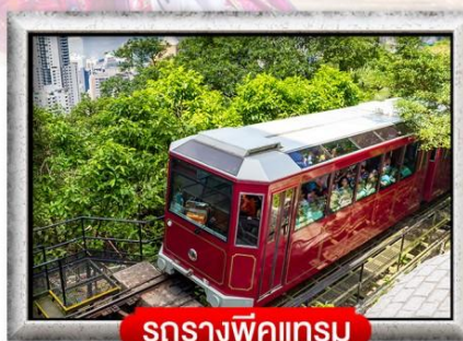
รถรางพิกแตรม