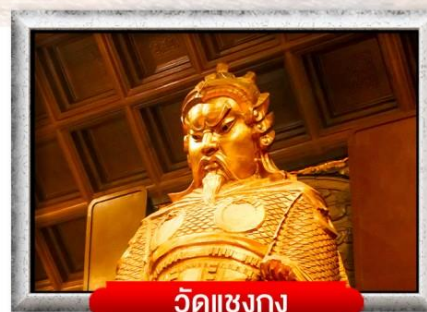
วัดแชงกง