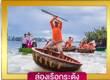
ล่องเรือกระดัง