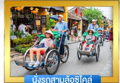
นั่งรถสามล้อซิโคล