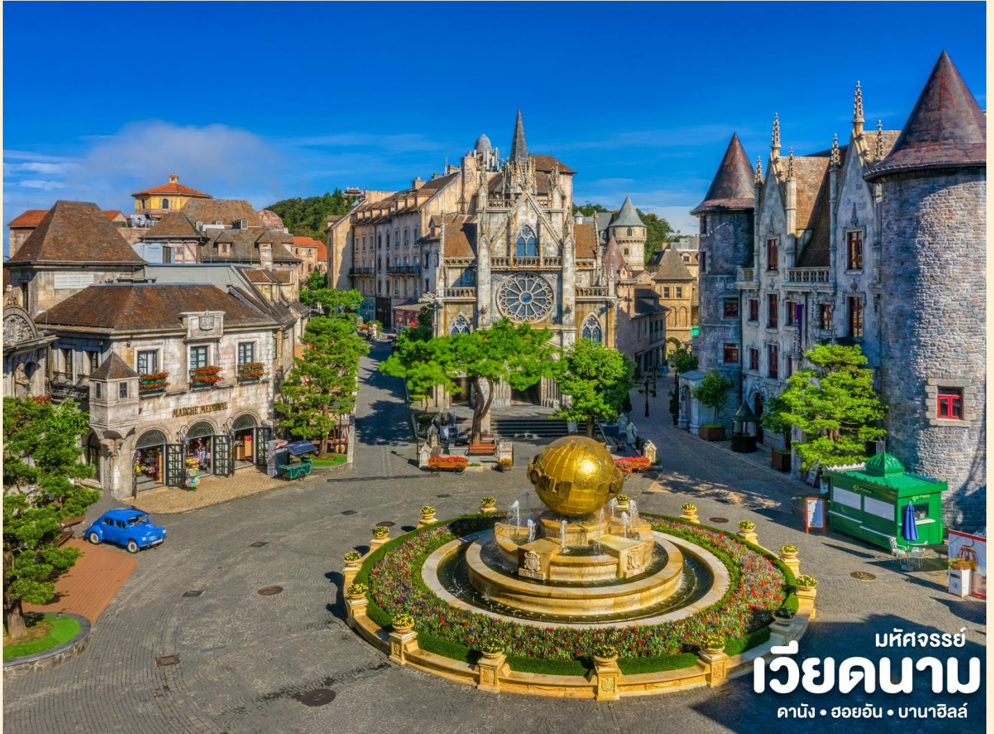
มัทศจรรย เวียคนาม ดานัง • ฮอยอัน • บานาฮิลล์

นำท่านชม สะพานสีทอง สถานที่ท่องเที่ยวใหม่ล่าสุดตั้งโดดเด่นเป็นเอกลักษณ์อย่างสวยงาม บนเขabanานาฮิลล์ นำท่านสู่จุดที่สร้างความตื่นเต้นให้นักท่องเที่ยวมองดูอย่างอึ้งการที่ซึ่งเต็มไปด้วยเสน่ห์แห่งตำนานและจินตนาการของการผจญภัยที่ สวนสนุก The Fantasy Park (รวมค่าเครื่องเล่นบนสวนสนุก ยกเว้น หุ่นขี้ผึ้ง