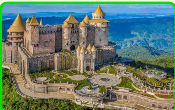
เที่ยวบานาฮิลล์แบบจุใจ เต็มวัน