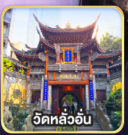
วัดหลัวอัน