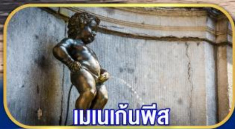
เมเนกันพีส