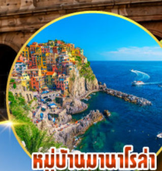
หมู่บ้านมานาโรซ่า

พิเศษ ลิ้มรสป่าร์มาแฮมถึงเมืองต้นกำเนิดแท้ๆ