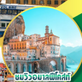
ชมวิวมอลฟีโคสตี