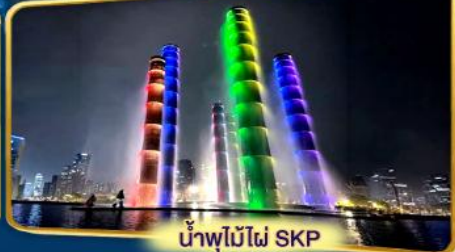
น้ำพุไม้ไผ่ SKP