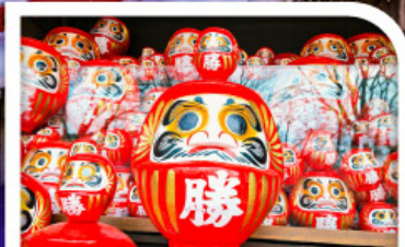
วัดแห่งชัยชนะ-วัดคัตสึโองิ(วัดคารุมะ)