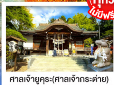
ศาลเจ้ายุคุระ (ศาลเจ้ากระต่าย)

พิเศษบุฟเฟ่ต์ซาบุดะพรีเมียม ปูออกโทโด อาหารทะเล เนื้อวากิว สเต็ก ซูชิโอคุระ และเครื่องดื่มไม่อัน