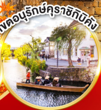
เขตอนุรักษ์คุราชิกิบิคัง