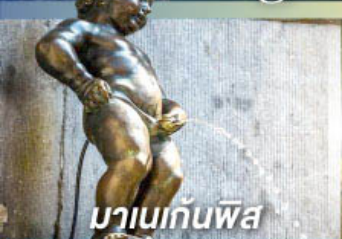
มานเนกันพิส