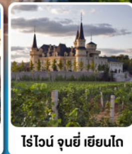
ไร่ไวน์ จุนยี่ เยียนโก