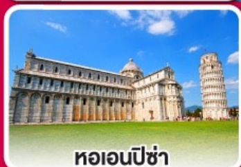
หอเอนปิซ่า