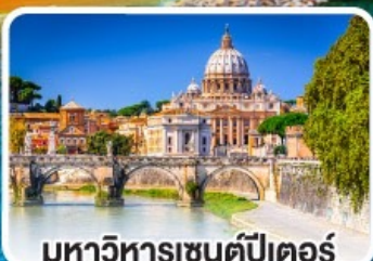
มหาวิหารเซนต์ปีเตอร์