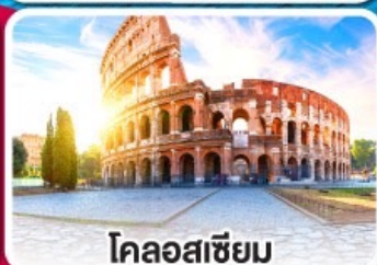
โคลอสเซียม