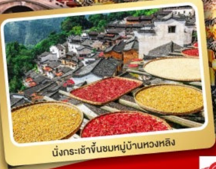
นั่งกระเช้าขึ้นชมหมู่บ้านหวงหลิง