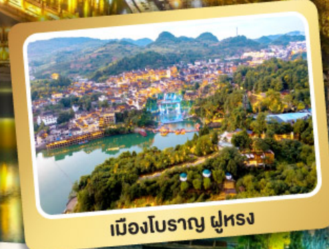
เมืองโบราณ ฝูหรง