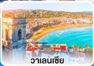
วาเลนเซีย