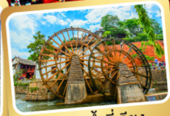
กังหันน้ำลี่เจียง