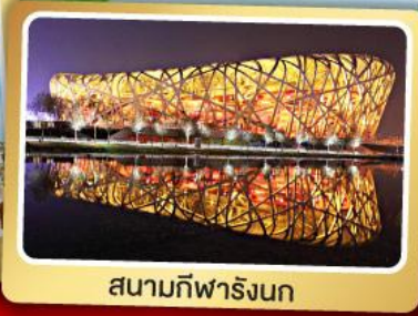
สนามกีฬาโอลิมปิก