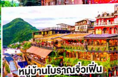
หมู่บ้านโบราณจิวเฟิน