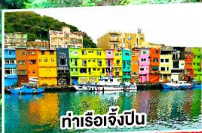
ท่าเรือเจิ้งปิง