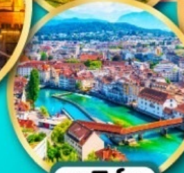
ลูเซิร์น