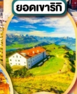
ยอดเขารีกิ