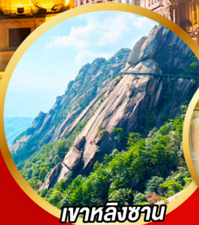
เขาลังซาน