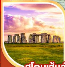
สโตนเฮนจ์