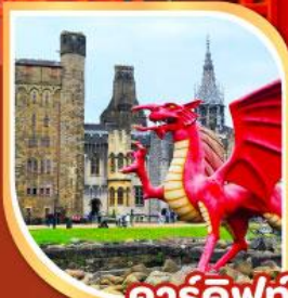
คาร์ดิฟฟ์