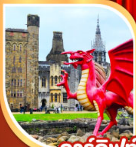
คาร์ดิฟฟ์