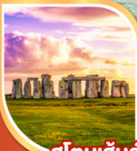
สโตนเฮนจ์