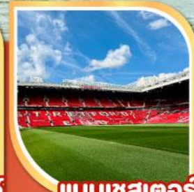
แมนเชสเตอร์