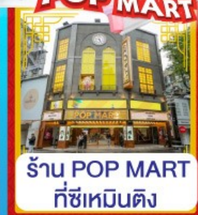
ร้าน POP MART ที่ซีเหมินติง