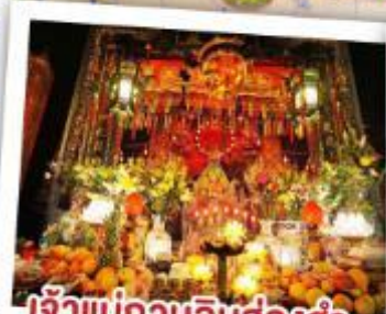
เจ้าแม่กวนอิมฮ่องฮำ