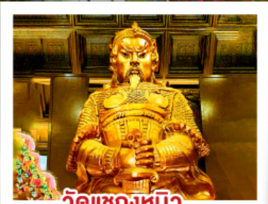
วัดแควงหมี