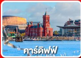
คาร์ดิฟฟ์