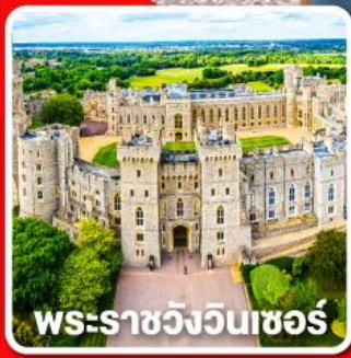
พระราชวังวินเซอร์

พักลอนคอน 4 คืนและ อิสระให้ท่านได้เที่ยวลอนดอนแบบเต็มอิ่ม 1 วัน