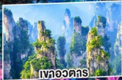
เวาอวตาร