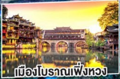
เมืองโบราณเฟิ่งหวง