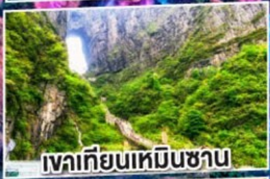
เวาเทียนเหมินซาน