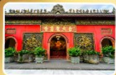
วัดต้าอื่อ