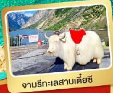
จามรีทะเลสาบเตี้ยซี