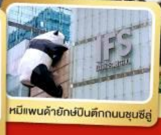
หมีแพนด้ายักษ์ปีนตึกถนนชุนชู่