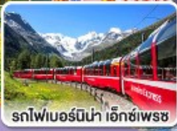
รถไฟเบอร์นีนา เอ็กซ์เพรส

รถไฟสายโรแมนติกและยอดเขาสุดพีคสุด อิตาลี สวิตเซอร์แลนด์ ออสเตรีย สโลวาเกีย 10 วัน 7 คืน