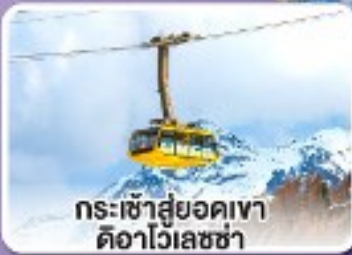
กระเช้าสู่ยอดเขา ดืออาไวเลซซา