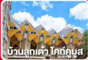
บ้านลูกเต๋า โคก์กูมูส

เยือนเมืองแปลกดินแดน 2 ประเทศ บาร์ล-นัสซา บาร์ล-เฮร์ตโท