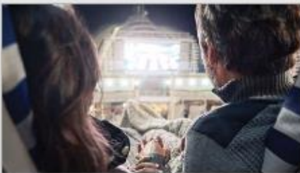
Movies Under the Stars®

Original musicals, dazzling magic shows, feature films, top comedians and nightclubs that get your feet movin' and groovin'. There's something happening around every corner; luckily, you have a whole cruise of days and nights to experience it all. 1