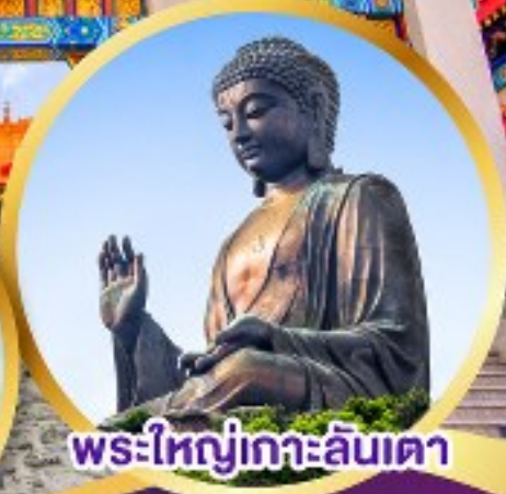
พระใหญ่เกาะลันเตา